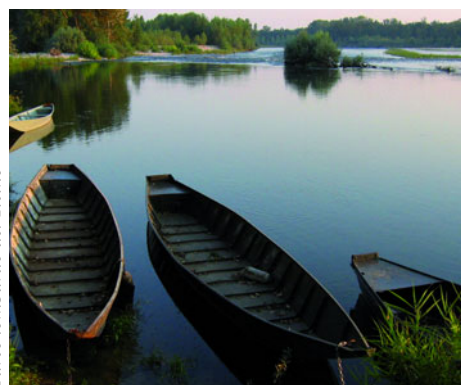
Parco lombardo del Ticino

Il rapporto annuale 2009 dell'Osservatorio Congressuale Italiano ha analizzato in dettaglio e posto a confronto 5 destinazioni italiane: Roma, Milano, Firenze, Torino e Rimini . I risultati dell'analisi comparativa effettuata dallo studio sono molto significativi per chi opera in Regione Lombardia. In termini di giornate di presenza congressuali, Roma fa la parte del leone: nel primo semestre 2009 ha realizzato 3,5 milioni di presenze congressuali, ospitando 1,7 milioni di congressisti che hanno partecipato a 19.685 incontri organizzati nell'area metropolitana romana. La provincia di Roma , quindi, è leader assoluta in termini produttivi fra le metropoli congressuali italiane analizzate, seguita da Milano con 2,6 milioni e da Rimini con 1,5 milioni di presenze congressuali. Considerando tuttavia il numero di incontri e di congressisti ospitati, la palma passa a Milano con oltre 21.000 eventi, seguita da Roma e Firenze - con distacco limitato -, mentre Rimini e Torino si collocano su livelli dimensionali più bassi.